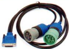
"Y" 6&9-Pin, 1m PN 493148