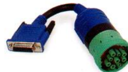
9 Pin DEUTSCH, c/s PN 493001