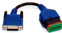
KOMATSU 12-Pin PN 493021