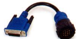
VOLVO 14-Pin PN 493022