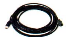
Cable USB 15' c/s PN 404032