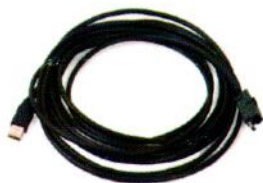
Cable USB de 15'

PN124032 INCLUYE: Interface NEXIQ USB-Link™2