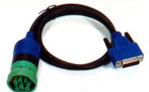
9-Pin DEUTSCH, 1m PN 493101