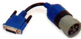
6-Pin DEUTSCH PN 494024