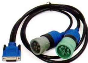
Adaptador "Y" de 6 & 9 Pins