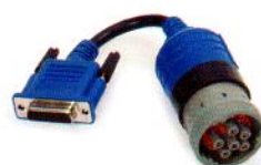
DDEC Marine PN 493007