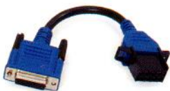
VOLVO 8-Pin PN 493020