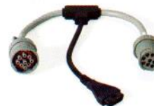
CAT "T" PN 493014