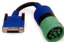
9-Pin DEUTSCH PN 493028